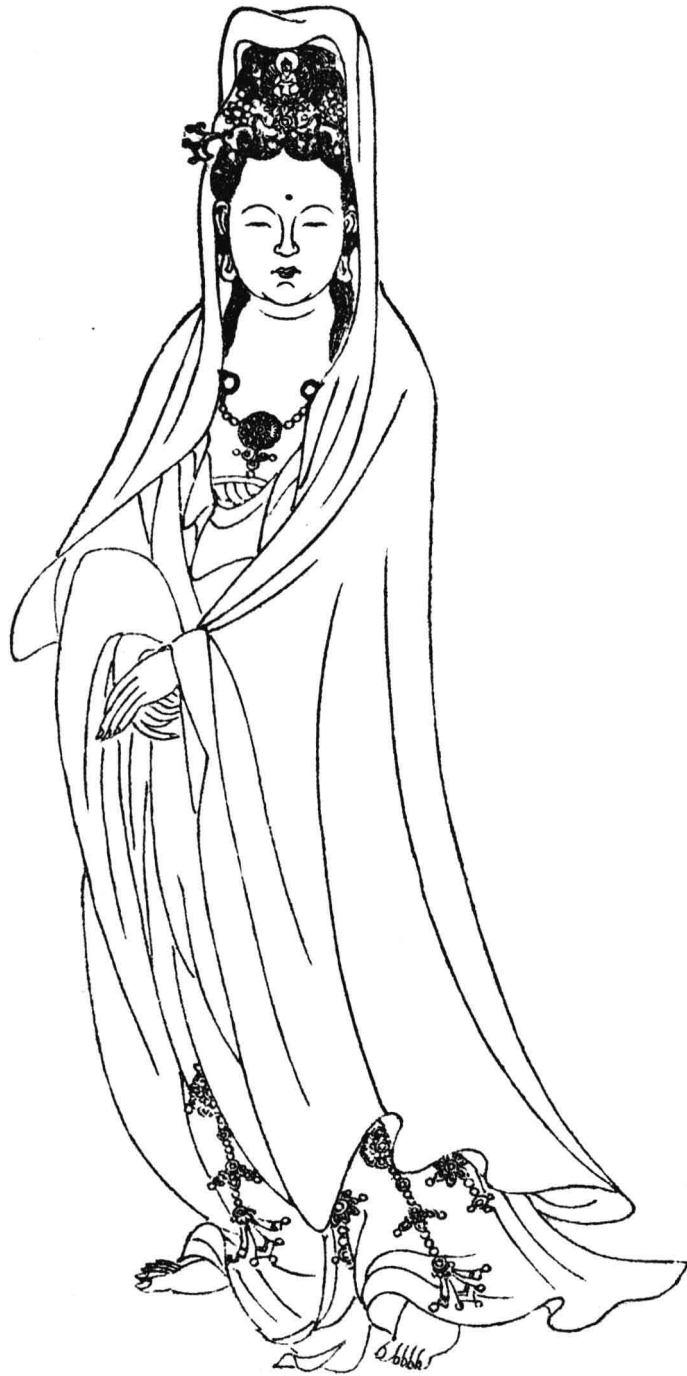
明代丁雲鵬觀音大士