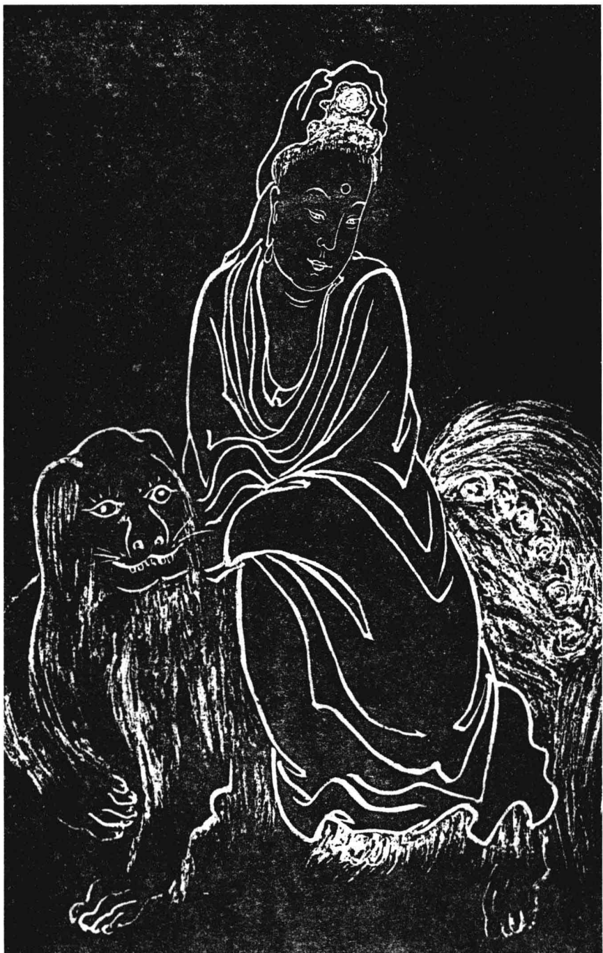
清軼名石刻獅吼觀音