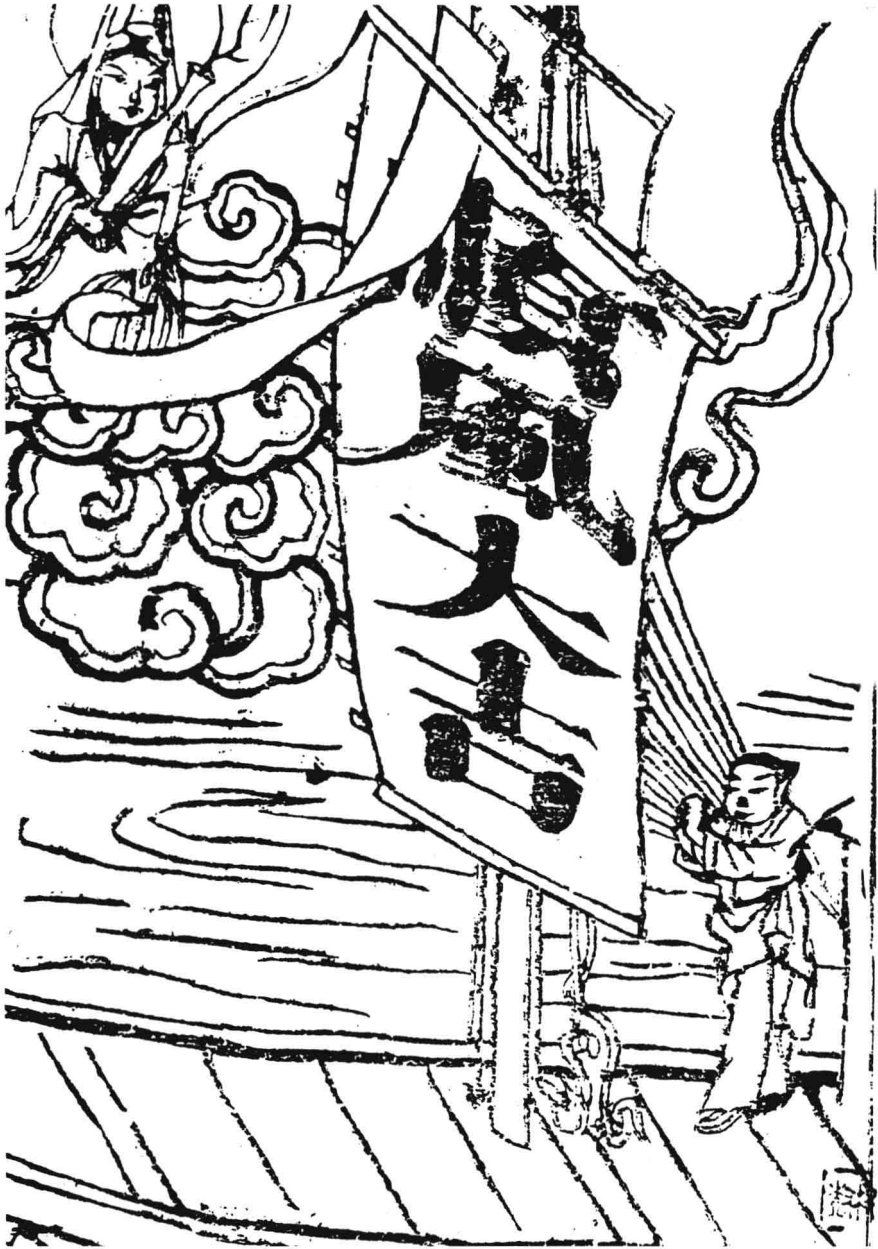
清代天津楊柳青紙馬觀音保佑順風大吉