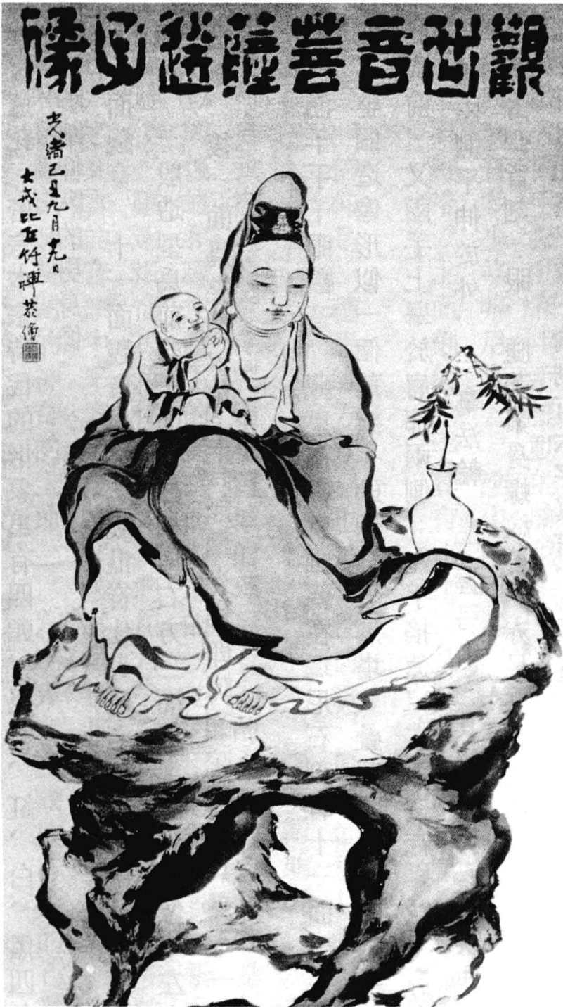
清代竹禪送子觀音