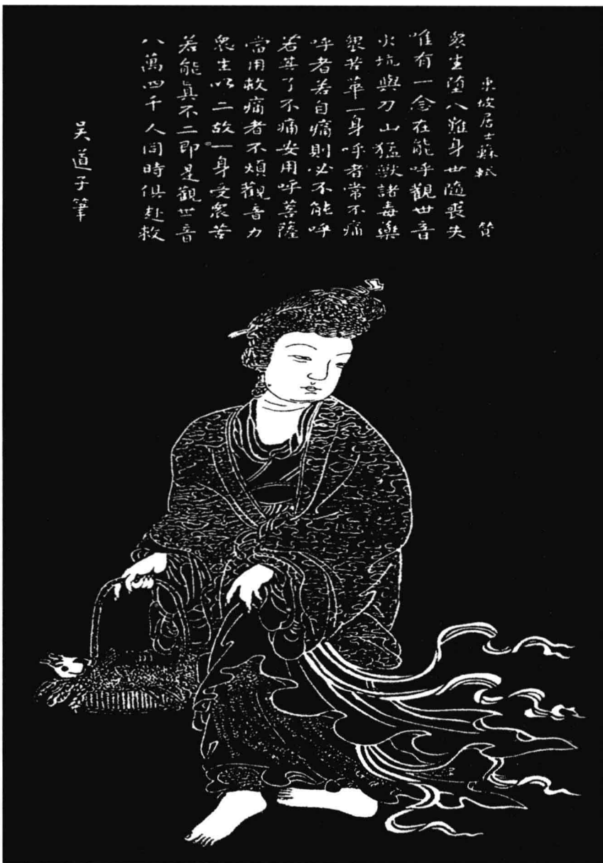
唐吳道子魚籃觀音