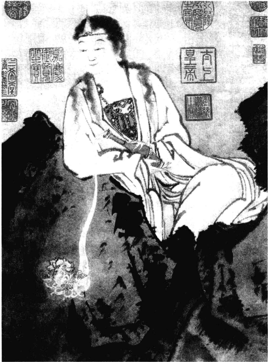
宋代賈師古甘露觀音