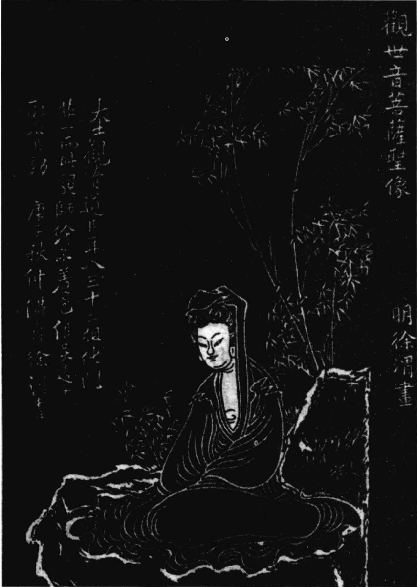
明代徐渭紫竹觀音