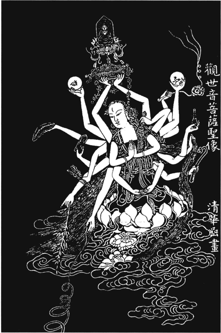
清代華岳千手觀音