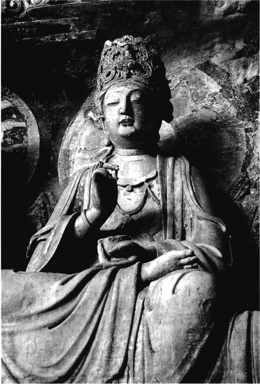
四川安岳華嚴洞北宋淨業障觀音